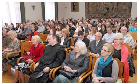
Goście konferencji „Przeciw melancholii. Perspektywy nauki i wiary”