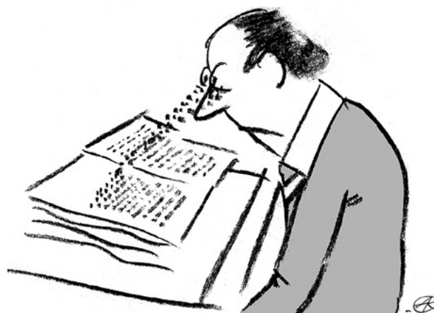
Rys. Adam Korpak