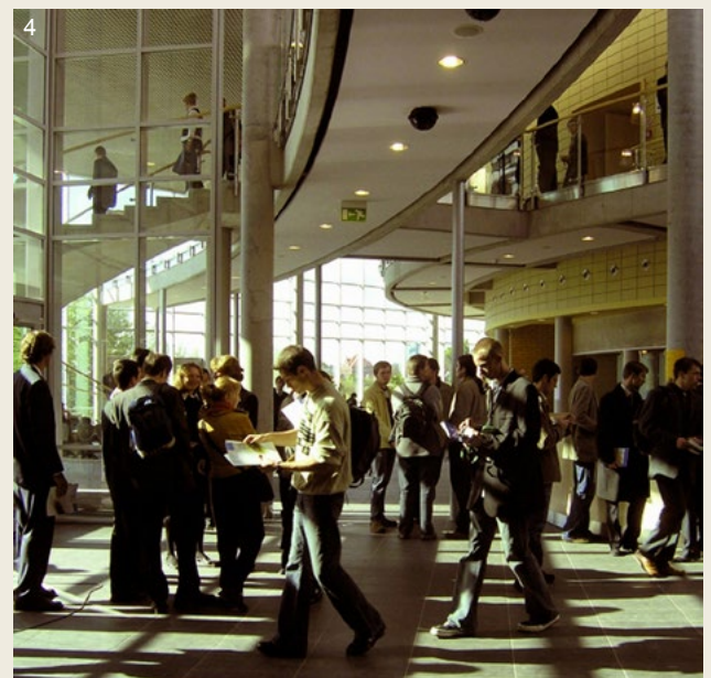
CWKiB w Kampusie PP – Warta w Poznaniu, I nagroda w konkursie w roku 2000, realizacja 2002–2010; 1. Powiązanie CWKiB z dominantami historycznymi Śródmieścia; 2. Wejście główne z forum PP; 3. Galerie Auli Magna; 4. Hol główny Centrum Wykładowego