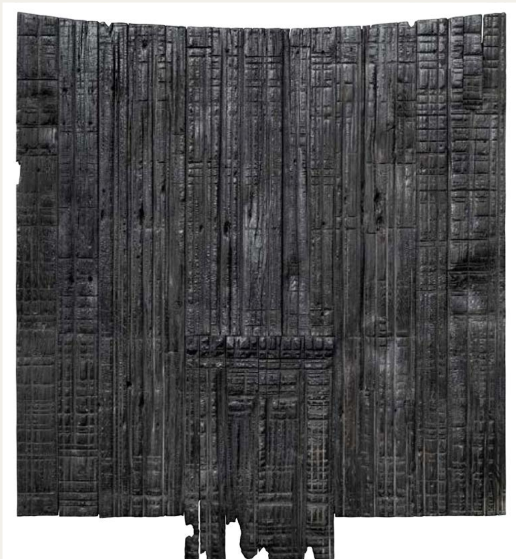
Oblicze , 2016 (relief, drewno sosnowe) 149x134 cm, własność Autora

Ważniejsze realizacje monumentalne: Idea Kopernika w New Delhi, Pomnik Obrońców Poczty Polskiej w Gdańsku, Pomnik Powstania Warszawskiego w Warszawie, Pomnik Jana Pawła II w Sochaczewie, Pomnik Armii Krajowej w Kielcach. Jego realizacje sakralne znajdują się w ponad 60 kościołach w Polsce i na świecie. Ważniejsze odznaczenia: Order Polonia Restituta II kl. Komandorskim z Gwiazdą, 1989; Złotym Medalem Zasłużony Kulturze Gloria Artis ; Złotym Medalem Ojca Świętego JP II oraz nagrodę im. Św. Brata Alberta za twórczość w dziedzinie rzeźby patriotycznej i sakralnej; Uhonorowany Equitem Commendatorem Ordinis Sancti Gregorii Magni, Watykan 2000; odznaczony Medalem Papieskiej Rady ds. Kultury Per Artem Ad Deum .