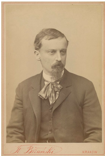
Henryk Sienkiewicz (1846–1916)

Wiadomym jest w społeczeństwie polskim, że Akademia tymi środkami, jakie ma nie może robić tyle, ile by chciała i mogła. Bez żadnej inicjatywy z jej strony, bez jej wiedzy nawet mogę powiedzieć, zjawia się w społeczeństwie, z jego własnego popędu myśl, żeby Akademię zasilić, wspomagać [...]. Radość zaiste wielka, widzieć, że lata naszych starań, nie przeszły bez wrażenia i bez skutku, że wzmagają się ufność i przychylność, że w społeczeństwie obudził się ten szlachetny popęd wspierania Akademii, łączenia się z nią.