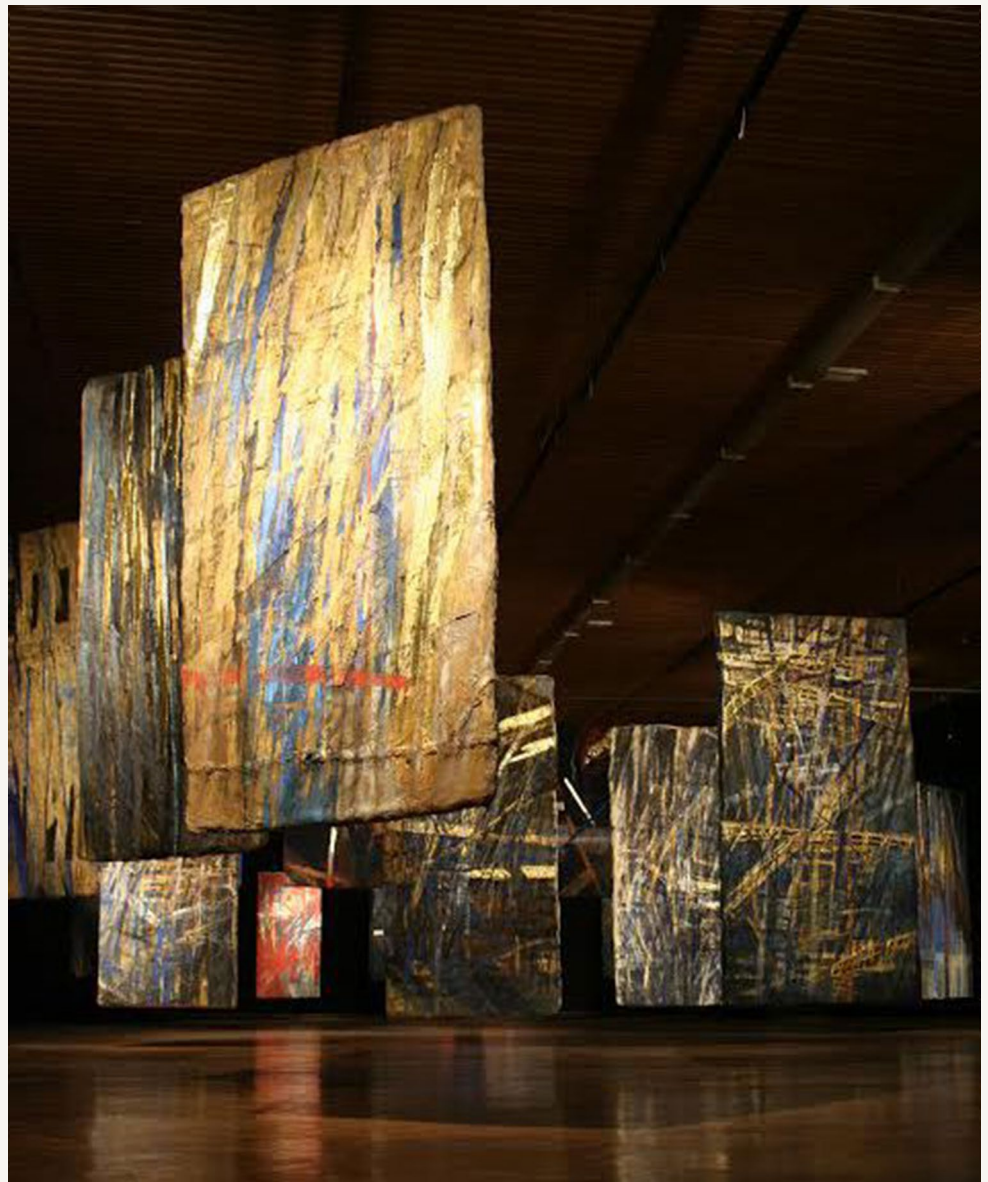
obiekto-obrazy z cyklu GENESIS, 2000/2015, na pierwszym planie DZIEŃ PIERWSZY – ŚWIATŁO DNIA i ŚWIATŁO NOCY, 207x108x7, płótno, akryl, olej, szlagmet+al, złoto, fragment ekspozycji w Miejskiej Galerii Sztuki w Częstochowie w 2015 roku